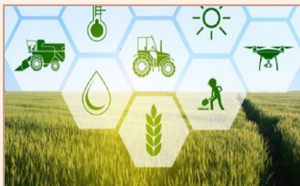
شکل ۳) عوامل متعدد دخیل در فرایند تولید، نقش بیمه در محصولات کشاورزی را ضروری می‌سازد.

به طور کلی بیمه کشاورزی به‌عنوان یکی از مکانیزم‌های مالی مدیریت ریسک، در تأمین امنیت سرمایه‌گذاری، امنیت تولید و در نتیجه دستیابی به توسعه پایدار کشاورزی نقش بسزایی خواهد داشت.