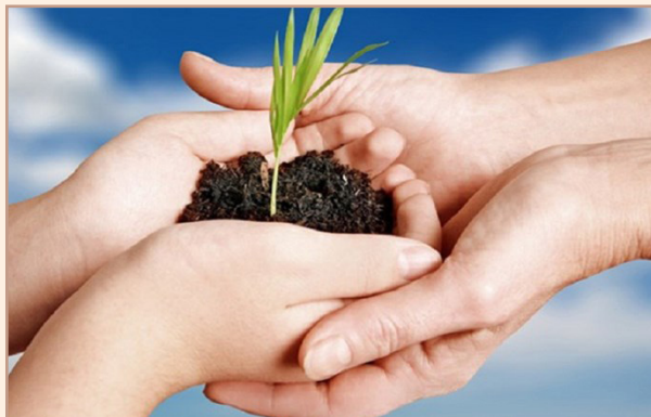
شکل ۶ بیمه امروز، آرامش نسل آینده