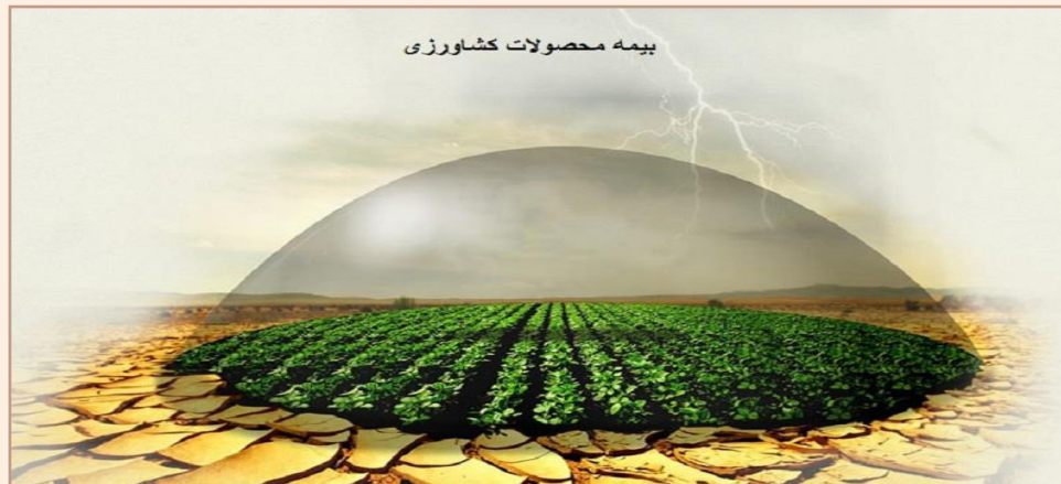
شکل (۱) بیمه محصولات کشاورزی، تضمین‌کننده تولید امن

از این‌رو ارتقا سطح دانش و مهارت مخاطبان خاص برنامه در جوامع محلی نظیر کشاورزان پیشرو، تولیدکنندگان برتر، تسهیلمگران روستایی و عشایری، مددکاران امور زراعی، باغی و دامی به عنوان نخبگان محلی بسیار حایز اهمیت است.