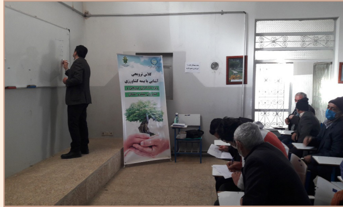
شکل ۵) آموزش مددکاران ترویجی با موضوع آشنایی با بیمه محصولات کشاورزی