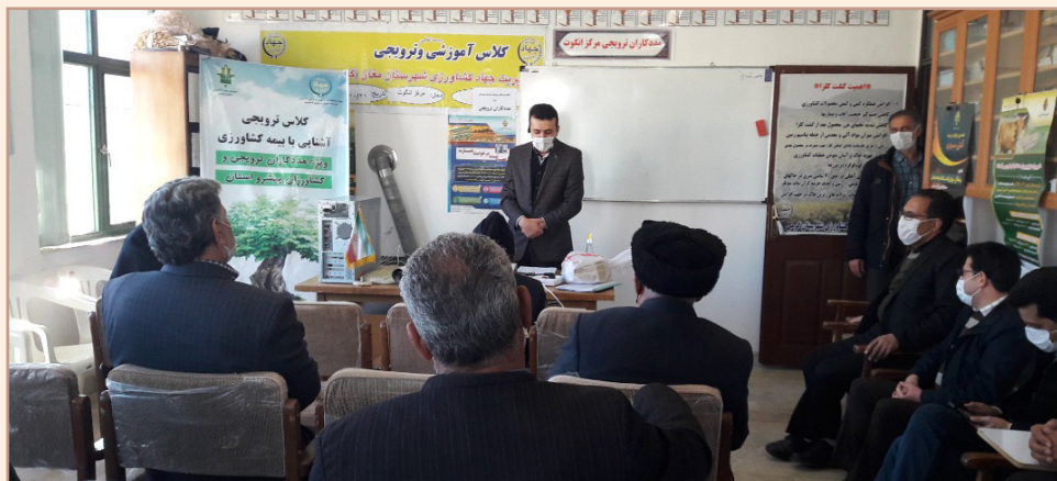
شکل ۲) آموزش مددکاران ترویجی در حوزه بیمه محصولات کشاورزی