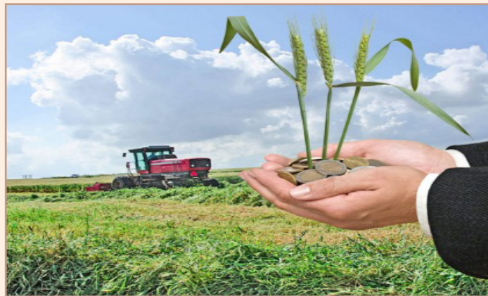
شکل ۴) نقش بیمه در محصولات کشاورزی، نقش سرمایه‌گذاری است تا هزینه‌کرد

متأسفانه خدمات بیمه‌ای در سبد مصرفی خانوارهای ایرانی جایگاه ویژه‌ای نداشته و بسیاری آن را به عنوان هزینه‌ای سربار و تحمیلی محسوب می‌کنند، که این امر از ضریب نفوذ پایین تقاضای بیمه، به خوبی قابل استنباط است. بنابراین تغییر ریشه‌ای این تفکر، نیازمند آموزش و فرهنگ سازی مناسب و هوشمندانه است. در این رابطه، ارتقای آگاهی بیمه‌گذاران در خصوص قوانین بیمه کشاورزی و اطلاع از آخرین یافته‌های مدیریت ریسک در تولید محصولات کشاورزی، غیرقابل انکار و بدون شک دارای بیش‌ترین نقش و تاثیر در روند رشد فرهنگ بیمه کشاورزی در جوامع روستایی و عشایری و افزایش ظرفیت بیمه‌پذیری بین بهره‌برداران بخش کشاورزی کشور است که لزوم آموزش‌های مهارتی بیمه محصولات کشاورزی را بیش از پیش نمایان می‌سازد.