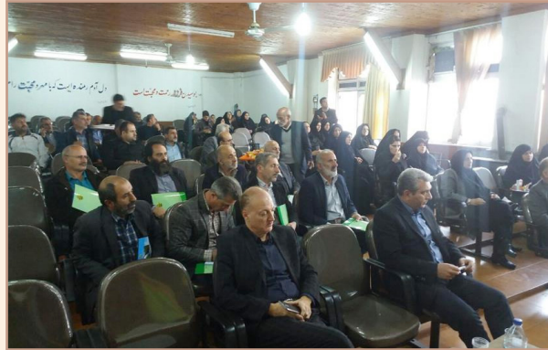
شکل ۷) برنامه آموزش مددکاران ترویجی در حوزه بیمه محصولات کشاورزی