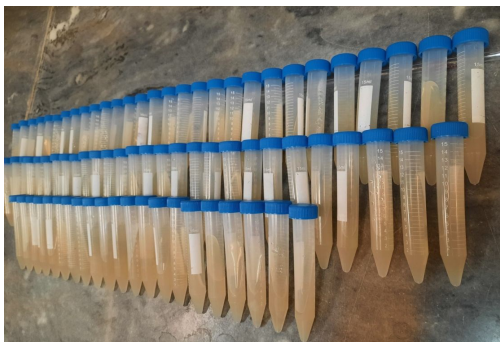
شکل 8- شیوه قرار دادن لوله‌ها روی سطح شیب‌دار

6. پس از سپری شدن دوره رشد در گرمخانه، درب لوله‌ها با پارافیلیم پوشانده، به یخچال و دمای 4 درجه سلسیوس انتقال داده شود (شکل 9).