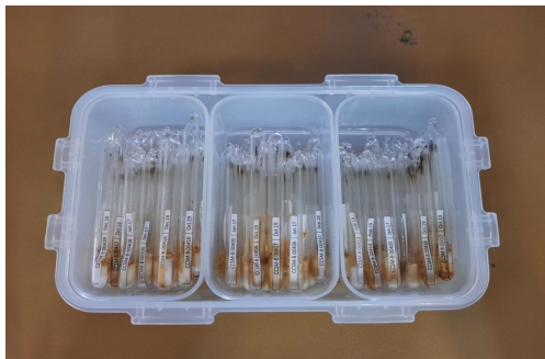
شکل 4- ذخیره لوله‌ها پس از برش در دمای 4 درجه سلسیوس