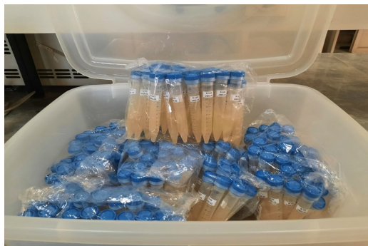
شکل 9- ذخیره لوله‌های کشت شده در دمای 4 درجه سلسیوس