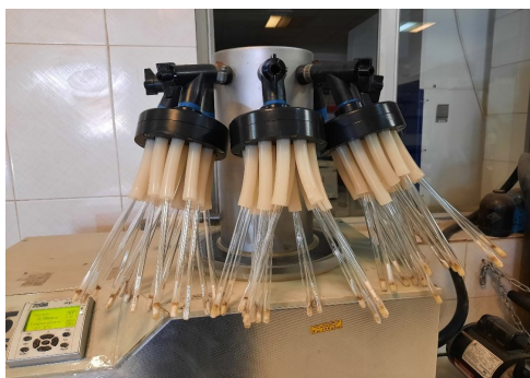
شکل 3- اتصال لوله‌های دارای باکتری به چمبر دستگاه فریز درایر