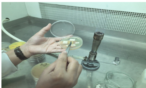
شکل 6- شیوه قرار دادن قارچ روی محیط کشت

4. پس از رشد قارچ و پوشیده شدن کاغذها توسط هیف‌های قارچ، کاغذها تحت شرایط استریل (با کمک پنس استریل) برداشته و بین دولای کاغذ استریل دیگری که از پیش آماده شده قرار داده شود. سپس کاغذها را داخل کیسه پلاستیکی (کیسه فریزر) گذاشته، به مدت 10 روز در مکان مناسب و دمای آزمایشگاه قرار داده تا خشک شود.