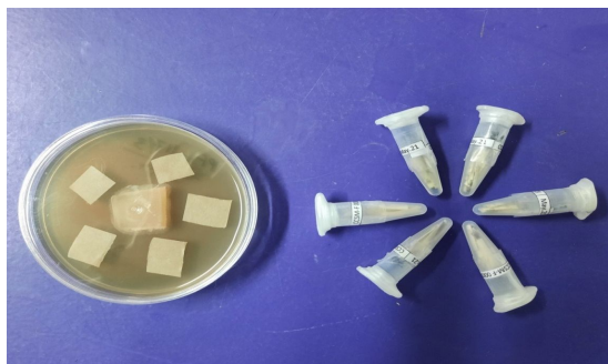
شکل 7- میکروتیوب‌های آماده برای ذخیره در کلکسیون

6. مشخصات نمونه روی میکروتیوب نوشته شده و درب آن با پارافیلیم پوشانده و در فریزر 20- درجه سلسیوس قرار داده شود (شکل 7).