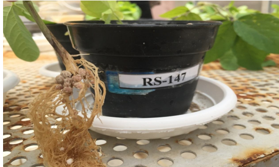
شکل 11- ریشه دارای گره‌های ریزوبیومی

4. نمونه‌ها به یخچال و دمای 4 درجه سلسیوس انتقال داده شوند (به نکته 2 مراجعه شود).