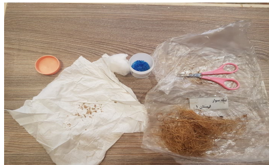
شکل 12- شیوه انتقال گره‌ها به ظروف دارای سیلیکاژل