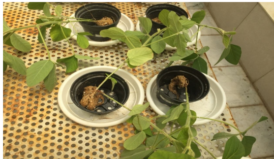
شکل 10- اندام هوایی همراه با ریشه