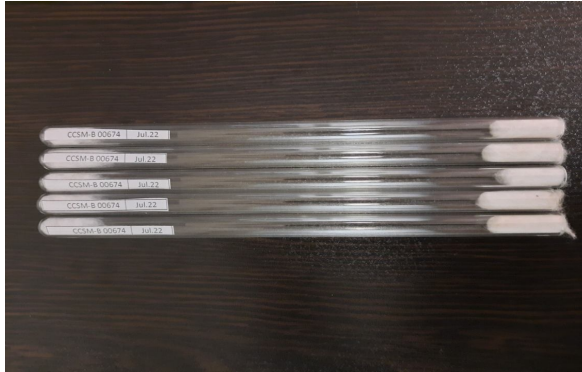
شکل 1- آماده سازی لوله‌های شیشه‌ای