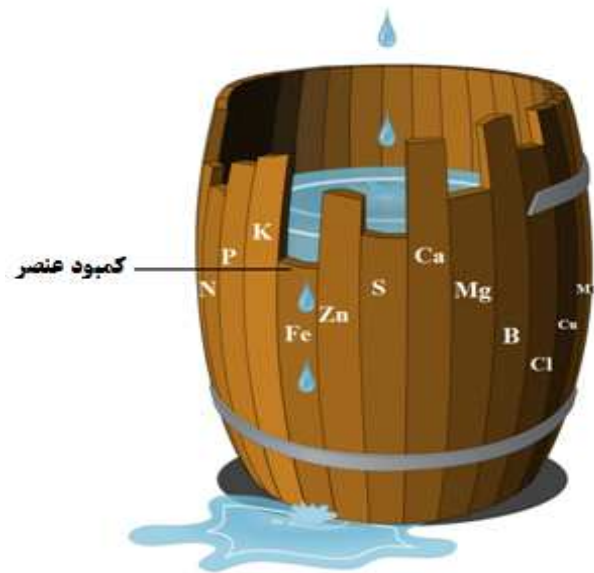
شکل ۱- نقش تامین متناسب عناصر غذایی مورد نیاز گیاه در تولید عملکرد قابل حصول

همانطور که اشاره گردید، اگر یک عنصر کمتر از حد بحرانی مقدار مورد نیاز گیاه در اختیارش قرار بگیرد (کمبود)، به شرط فراهم بودن حد مطلوب سایر عناصر، مقدار تولید محصول تابع آن عنصر بوده و با افزایش غلظت‌اش در گیاه، عملکرد نیز افزایش می‌یابد تا به یک مقدار حداکثر می‌رسد. بعد از این مرحله، با افزایش غلظت آن عنصر در گیاه، عملکرد تغییری نمی‌کند (حد کفایت). اگر غلظت عنصر غذایی باز هم افزایش یافته و از یک حد معینی فراتر رود، گیاه دچار مسمومیت شده و عملکرد شروع به کاهش می‌کند. این مراحل در شکل ۲ نشان داده شده است. حد کمبود، کفایت و سمیت برای هر عنصر متفاوت بوده و شناخت این دامنه‌ها در هر گیاه برای تولید محصول مناسب، بسیار مهم و ضروری می‌باشد. در حد کفایت با افزایش غلظت عنصر در خاک، عملکرد تغییر نمی‌کند.