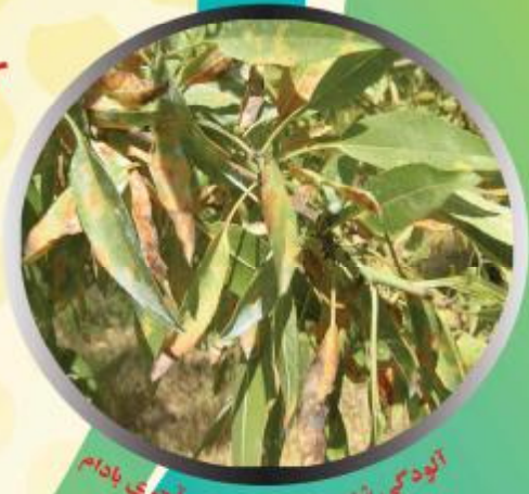
آلودگی شدید درختان به لکه آجری بادام

چون زمستان گذرانی قارچ در برگ های ریخته شده کف باغ سپری می شود بنابراین جمع آوری برگهای ریخته شده در سطح خاک و سوزاندن آنها در اواخر پاییز، مقدار مایه آلودگی قارچ را برای فصل بعد کاهش می دهد.