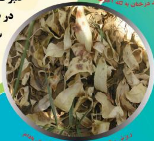
ذرات قارچ ها در اثر بیماری لکه آجری بادام