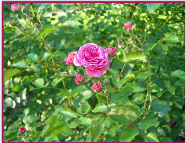
شکل ۱- درختچه ی گل محمدی

محمدی یا گل گلاب با نام علمی Mill Rosa damasena (شکل ۱)، گیاهی است که از تلاقی بین گونه های R. galica L و R. canina L به وجود آمده و واریته ها و انواع گوناگونی برای آن نام برده شده است. گل محمدی درختچه ای است دارای شاخه های گل دهنده تیغ دار، استوانه ای شکل، بدون شیار و دارای برگ های مرکب شانه ای با ۳-۵ برگچه متقابل دنداندار است. رگبرگ های پشت برگ مشخص و به هم رفته، برگچه چرمی و بیضی شکل، نوک تیز به طول ۳-۵ سانتی متر، و روی برگ ها صاف و سبز و پشت آنها سبز کم رنگ و دمبرگ هایش خزی و نمدی است. گل ها به شکل صورتی خوشرنگ با ۳۲ گلبرگ صورتی مشابه و یکدست که در اوایل صبح ظاهر می شوند. کاسبرگ ها به تعداد ۵ عدد که حداقل سه تای آنها دارای زوائد بزرگی در لبه ها هستند. پرچم ها زرد رنگ به تعداد ۱۰۰ عدد در ترکیب گل وجود دارند. میوه آن پس از ریزش گلبرگ ها گوشتی گرد و یا تخم مرغی شکل است.