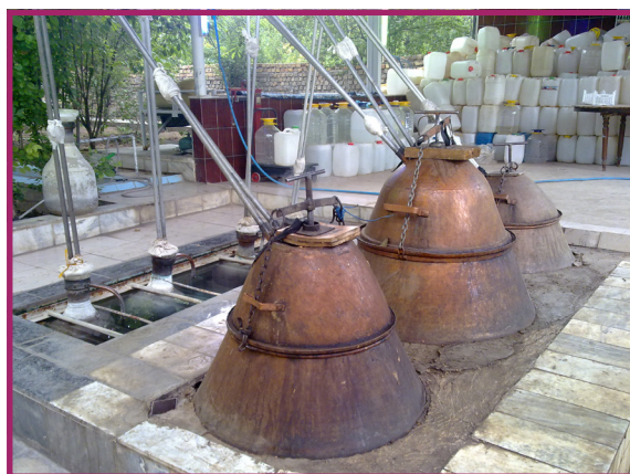
شکل ۱۲- گلاب گیری

محصولات به دست آمده از گل محمدی به ویژه اسانس، گلاب و گل خشک علاوه بر مصرف داخل کشور، از اقلام مهم صادراتی نیز است و عطر آن از مقبولیت خاصی در جهان برخوردار است. اسانس گل محمدی نیز در صنایع عطرسازی و آرایشی و عطر درمانی مورد استفاده قرار می گیرد. مقدار نسبتاً زیادی روغن های فرار در گلبرگ های معطر گل محمدی وجود دارد که توسط بخار آب استخراج می شود. از هر ۳۰۰۰ کیلوگرم گل، حدود یک کیلو اسانس به دست می آید. اسانس گل سرخ محمدی، مخلوط پیچیده ای از بیش از ۱۰ ترکیب مختلف است. بیشترین ترکیب از شکوفه های گل بدست می آید فنیل اتیل الکل و دیگر ترکیب های اصلی آن شامل الکل های ژرانیول، سیترونلول و نرول است. سیترونلول، نرول و ژرانیول از مهمترین مواد فراری هستند که استفاده گسترده ای در صنایع عطرسازی، آرایشی و تهیه صابون ها دارند. فنیل اتیل الکل نیز یکی از مهمترین مواد معطر مصرفی در عطرها، مواد آرایشی و صابون ها و صنایع طعم دهنده به شمار می رود. این الکل در همه انواع عطرها به کار می رود و در ترکیب های اسانس گل سرخ غیرقابل چشم پوشی