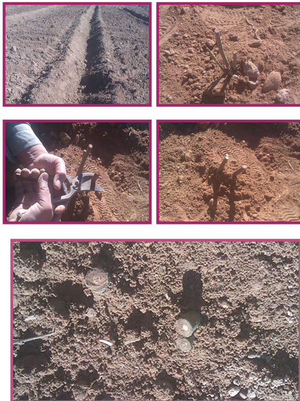
شکل ۹- مراحل کشت دیم گل محمدی