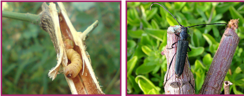
شکل ۶- حشره کامل (راست) و لارو (چپ) سوسک شاخک بلند

از آفات دیگر می توان به آفت مهم ساقه خوار یا سوسک شاخ بلند رزاسه اشاره کرد که تخم آن در بهار تبدیل به لارو می شود. این لارو از نوک شاخه ها و از درون، به خراطی و پوک کردن ساقه ها می پردازد و گاهی تا مرحله خشکاندن گیاه پیش می رود (شکل ۶).