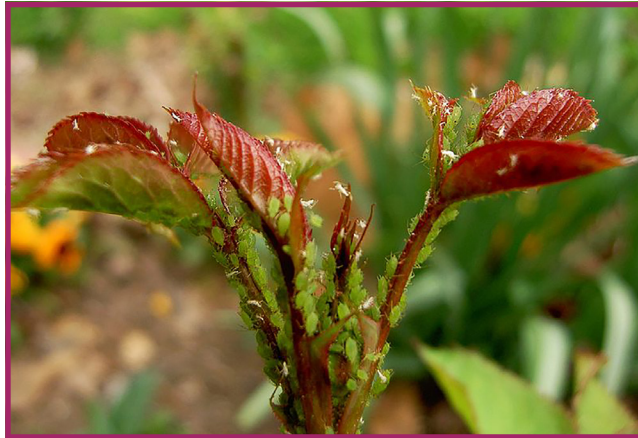
شکل ۴- شته گلسرخ

از آفت های دیگر می توان به سپردار سفید گل سرخ اشاره کرد که این حشره ها به شکل پولک های خیلی ریز و گرد به رنگ سفید مایل به خاکستری روی ساقه های گل محمدی دیده می شوند (شکل ۵).