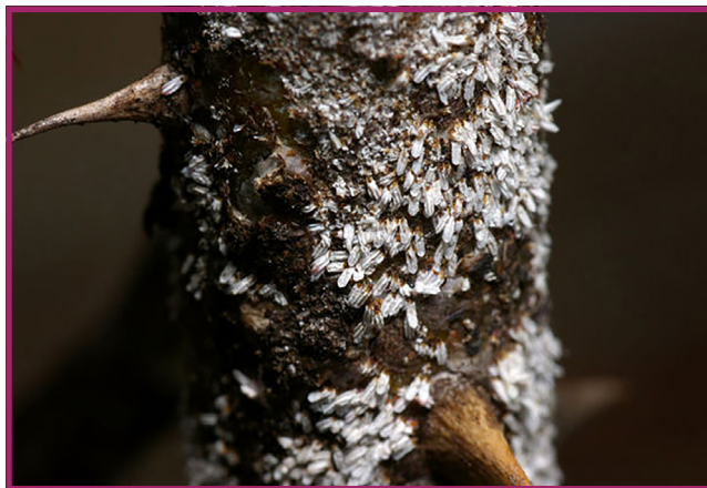
شکل ۵- سپردار سفید رز

از آفت های دیگر می توان به سپردار سفید گل سرخ اشاره کرد که این حشره ها به شکل پولک های خیلی ریز و گرد به رنگ سفید مایل به خاکستری روی ساقه های گل محمدی دیده می شوند (شکل ۵).