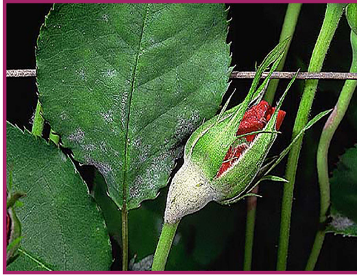
شکل ۷- سفیدک حقیقی

میزان زیان های وارده به گلستان ها بر اثر حمله این بیماری، کم و بیش زیاد و گاهی تا بیش از ۵۰ درصد محصول می رسد. از بیماری های دیگر گل محمدی می توان به بیماری زنگ اشاره کرد که هر ساله باعث خسارت های فراوانی در گلستان های کشور بلغارستان می شود (شکل ۸).