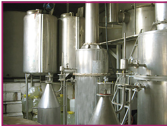
شکل ۱۱- اسانس گیری

مغولان همراه با نابودی همه چیز، این صنعت را نیز دچار رکورد کرد، به طوری که از آن تاریخ تاکنون این صنعت رواج قبلی خود را باز نیافته است. هنر گلابگیری در قرن دهم میلادی توسط اعراب به اروپا برده شد و اولین کشور اروپائی که این هنر را در خدمت گرفت، اسپانیا بود. عطر و گلاب گل سرخ ایران به علت شرایط مناسب آب و هوایی، از مرغوبیت خاصی برخوردار است و به جهت اینکه به مقدار کم تولید و بیشتر در داخل کشور مصرف می شود، از شهرت جهانی برخوردار است. اکثر کشورهای عربی حوضه خلیج فارس، انواع مختلف عرقیات و گلاب را از ایران تهیه می کنند. متأسفانه اکثر مراکز و کارگاه های گلابگیری کشور به صورت سنتی فعالیت می کنند. کمتر تولید کننده ای با ترکیبات شیمیایی مواد تولید شده آن آشنائی دارد. ارزشمندترین بخش قابل مصرف گل محمدی گل های آن است که به صورت های مختلف در غذای انسان به مصرف می رسد. در حال حاضر نیز گل محمدی عمده ترین منبع جهت استحصال اسانس رز به شمار می آید (شکل ۱۱ و ۱۲).