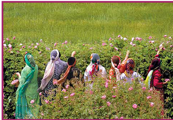
شکل ۱۰- برداشت گل محمدی

زمان و چگونگی برداشت محصول (شکل ۱۰) به جایگاه طبیعی و آب و هوای منطقه بستگی دارد. میانگین مقدار محصول یک درختچه، دو کیلوگرم است. همچنین تعداد گل های یک درختچه در طول برداشت نزدیک به ۱۰۰۰ عدد است. برداشت گل از مهمترین، حساس ترین و پرهزینه ترین مراحل تولید گل محمدی است. زمان گلدهی گل محمدی در شهرکرد حدوداً "از اواخر اردیبهشت تا اوایل تیرماه است. گل محمدی پس از بازشدن دوام کمی روی شاخه دارد و در صورت تأخیر طی ۲۴ ساعت رنگ آن به سفیدی گراییده و می ریزد. تأخیر زمان برداشت باعث افت شدید گلاب و اسانس استحصال شده می شود. با توجه به تعداد نسبتاً زیاد گل که در هر بوته تولید می شود لازم است قبل از طلوع آفتاب و بهتر است در هوای خنک بامدادی اقدام به برداشت روزانه گل های باز شده کرد. با گرم شدن هوا، گل های برداشت شده به سرعت پژمرده و فعالیت های تخمیری در گل ها که معمولاً روی هم انبار و فشرده می شوند تشدید می شود. لذا باید هرچه سریعتر به کارگاه های اسانس گیر ارسال و اسانس گیری شوند.