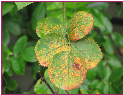
شکل ۸- زنگ رز

میزان زیان های وارده به گلستان ها بر اثر حمله این بیماری، کم و بیش زیاد و گاهی تا بیش از ۵۰ درصد محصول می رسد. از بیماری های دیگر گل محمدی می توان به بیماری زنگ اشاره کرد که هر ساله باعث خسارت های فراوانی در گلستان های کشور بلغارستان می شود (شکل ۸).