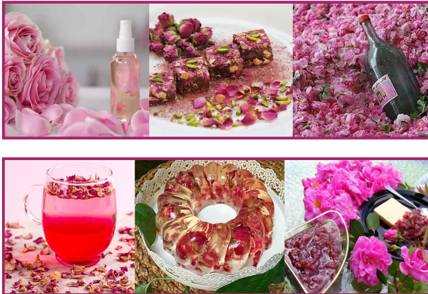
شکل ۲- مصارف گل محمدی