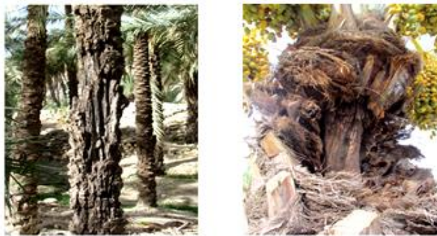
شکل 2) حشره ایجاد شده در تنه توسط O. elegans .

ب) O. agamemnon : این گونه خیلی شبیه O. elegans است. با این تفاوت که ساق پای جلویی در رویه زیر بدون دندان و بدن کوتاهتر، پهن تر و معمولاً به رنگ قرمز قهوه‌ای است (برومند، 1347). بیشترین فعالیت این حشره در ریشه‌های تنفسی، دمبرگ برگ‌های هرس شده و پوست تنه دیده شده است (Soltani, 2010). به عقیده Soltani, et al. (2008) خسارت این آفت در نخلستان‌های تازه احداث شده و پاجوش‌ها در تونس به 100% هم می‌رسد. بیولوژی و نحوه خسارت این آفت در نخلستان‌های ایران بررسی نشده است. ما این سوسک را با استفاده از تله نوری در نخلستان‌های استان بوشهر شکار کردیم.