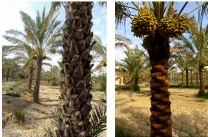
شکل ۳) دمبرگ‌های هرس شده نخل (سمت راست) و هرس نشده (سمت چپ)

3- مبارزه شیمیایی: با توجه به این که لاروها و شفیره‌های این سوسک‌ها در داخل تاج و تنه درخت فعالیت دارند و در معرض مستقیم سم قرار نمی‌گیرند، مبارزه شیمیایی با آنها عملی نیست. از طرف دیگر کاربرد سموم سیستمیک مانند استامی‌پراید، ایمیداکلوپراید و تیمتوکسام بر علیه لارو سوسک کرگدنی بی‌تاثیر بوده است (Anonymous, 2012).