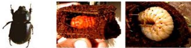
شکل 1) لاروسن آجبر، شفیره داخل گهواره (Khalaf, et al., 2010) و حشره کامل O. elegans .

لاروها قبل از شفیره شدن برای خود حفره‌هایی درست می‌کنند که گهواره نامیده می‌شود (شکل 1) و در داخل این حفره به شفیره تبدیل می‌شوند دوره شفیرگی 3-4 هفته است و سپس حشره کامل ظاهر می‌شود.