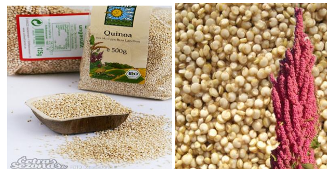
سازمان ملل سال ۲۰۱۳ را سال بین المللی گیاه کینوا نامگذاری کرد

سازمان جهادکشاورزی استان تهران برنامه ریزی کرده تا گیاه جدیدی به نام کینوا را در منطقه کشت کند. کارشناسان جهادکشاورزی میخواهند تا بذرها بصورت آزمایشی در زمین یکی از کشاورزان کشت نمایند. وقتی موضوع را برای بهره برداران تشریح می نمایند کشاورز کارآفرین خیلی سریع تصمیم گرفته و اعلام همکاری میکند