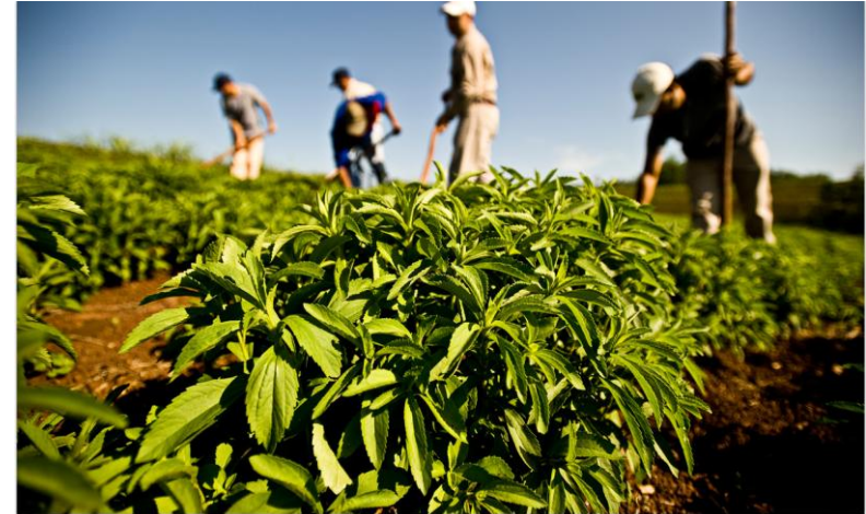
گیاه استویا - شیرینتر از قند و بدون کالری

*ایجاد هرگونه تشکیلات جدید: مثل راه اندازی مراکز رشد و کارآفرینی زنان روستایی و عشایری بخش کشاورزی و یا راه اندازی صندوق حمایت از توسعه بخش کشاورزی.