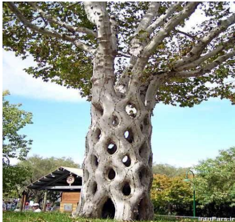
خلاقیت در پرورش درختان

آشنایی با مباحثی مثل ایده یابی ، خلاقیت و نو آوری ، اصول ارتباط ، مباحث مدیریت مالی ، بازاریابی ، مدیریت منابع انسانی ، مبانی و مفاهیم کسب و کار ، آشنایی با حقوق تجاری شرکتها ، نوشتن طرح کسب و کار ، و .... بسیاری از مباحث دیگر بصورت عملی و کارگاهی و روش مشارکتی به فراگیران آموزش داده می شود