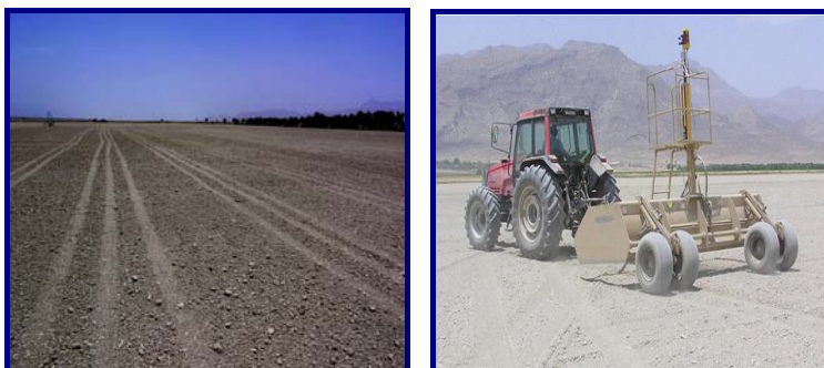
شکل ۲- بهبود مدیریت آبیاری با تسطیح اراضی

برخی کشورهای اروپایی و استرالیا به طور وسیع و در کشورهای در حال توسعه نظیر پاکستان، مصر، هند و ترکیه به طور نسبی استفاده می‌شود. تسطیح اراضی باعث صرفه‌جویی ۲۵-۲۰ درصد در مصرف آب، افزایش سطح زیر کشت، کاهش هزینه‌های آبیاری، افزایش عملکرد تا حدود ۷ درصد می‌شود.