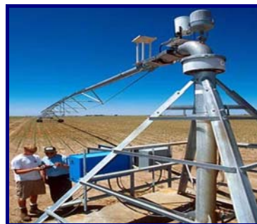
شکل ۶- نمونه‌هایی از تجهیزات مورد نیاز برای خودکارسازی در سامانه‌های آبیاری