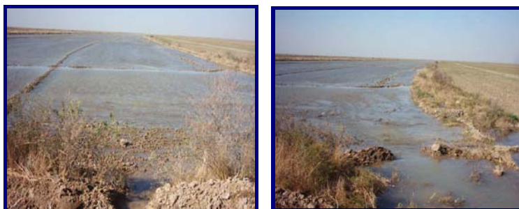
شکل ۴- نمونه‌هایی از تلفات آب آبیاری در مزرعه

از آنجا که یکی از موارد هدر رفت آب، توسعه ناکافی آبیاری شبانه در خیلی از مناطق و رها کردن آب در مزرعه می‌باشد (شکل ۴، در این گونه موارد، آبیاری سطحی باید به گونه‌ای طراحی شود که طول مزرعه و مدت زمان آبیاری طولانی باشد. به نحوی که آبیاری از غروب شروع و تا صبح ادامه یابد. در این شیوه، طول جویچه‌ها (در صورت استفاده از آبیاری جویچه‌ای) بیشتر از طول معمولی طراحی می‌شود. به عنوان مثال، طول جویچه‌های ذرت در باجگاه فارس که به طور معمول ۱۰۰-۲۰۰ متر است، در آبیاری شبانه به ۴۰۰-۵۰۰ متر می‌رسد و مدت زمان آبیاری هم به ۳۶۰ الی ۵۵۰ دقیقه افزایش می‌یابد. با طول جویچه ۵۰۰ متری مدت زمان آبیاری تقریباً برابر طول شب خواهد شد. ضمن این که بازده کاربرد به حدود ۶۴ درصد افزایش می‌یابد (ابراهیمی و همکاران، ۱۳۷۵).