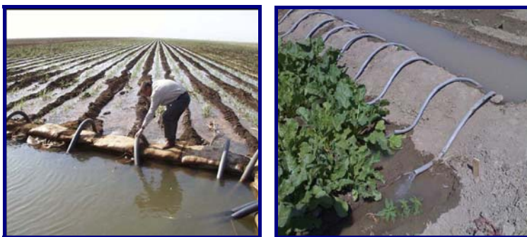
شکل ۳- نمونه‌هایی از آبیاری با سیفون برای توزیع یکنواخت آب در مزرعه