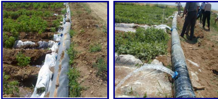
شکل ۵- نمونه هایی از کاربرد هیدروفلوم در مزرعه

مصرف کود حدود ۳۰ درصد، صرفه جویی در هزینه های کارگری حدود ۴۰ درصد، افزایش عملکرد تا حدود ۱۰ درصد، کاهش مصرف علف کش ها و سهولت کاربرد ماشین آلات در مزارع می شود.