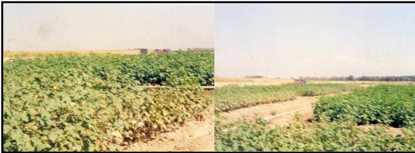
شکل ۴- آثار سوختگی برگ در گیاه پنبه در اثر آبیاری بارانی با آب شور

مناطق با پتانسیل بیماری هوازاد (آلترناریا) آبیاری بارانی مفید نیست ولی برای بیماریهای خاکزاد (ورتیسیلیوم) آبیاری بارانی نسبت به روش سطحی ترجیح داده میشود. در هنگام استفاده از آب شور در روش بارانی باید با احتیاط عمل کرد. کاربرد آب شور در آبیاری بارانی به دلیل تماس آب با اندامهای هوایی گیاه باعث سوختگی برگ ها، کاهش سطح برگ و ریزش زودهنگام آنها می شود (شکل ۴). نتایج بررسی آبیاری با آب شور روی گیاه پنبه نشان داده است که در آبیاری بارانی شوری آب آبیاری (۷/۸ دسی‌زیمنس بر متر) عملکرد پنبه را ۳۶ درصد کاهش داده است. در حالی که آبیاری نشتی در همان شوری عملکرد پنبه را ۱۹ درصد کاهش داده است. بعضی از تمهیدات لازم برای کاهش خسارت شوری در آبیاری بارانی عبارتند از: آبیاری شبانه، تغییر دبی آب پاش‌ها، شستشوی برگ‌ها با آب شیرین به مدت کوتاه (مثلاً ۱۵ دقیقه) پس از اتمام آبیاری، افزایش فاصله آبیاری و انجام آبیاری سنگین.