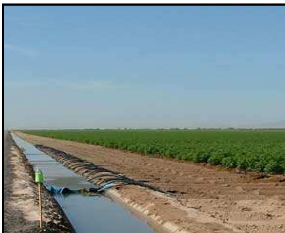
شکل ۲- نمایی از مزرعه پنبه تحت آبیاری شیاری با استفاده از لوله دریچه‌دار و سیفون