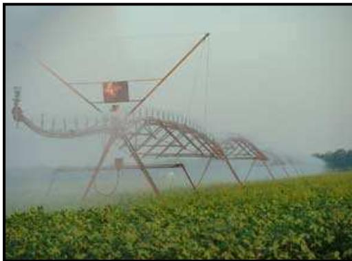
شکل ۳- نمایی از مزرعه پنبه تحت آبیاری بارانی