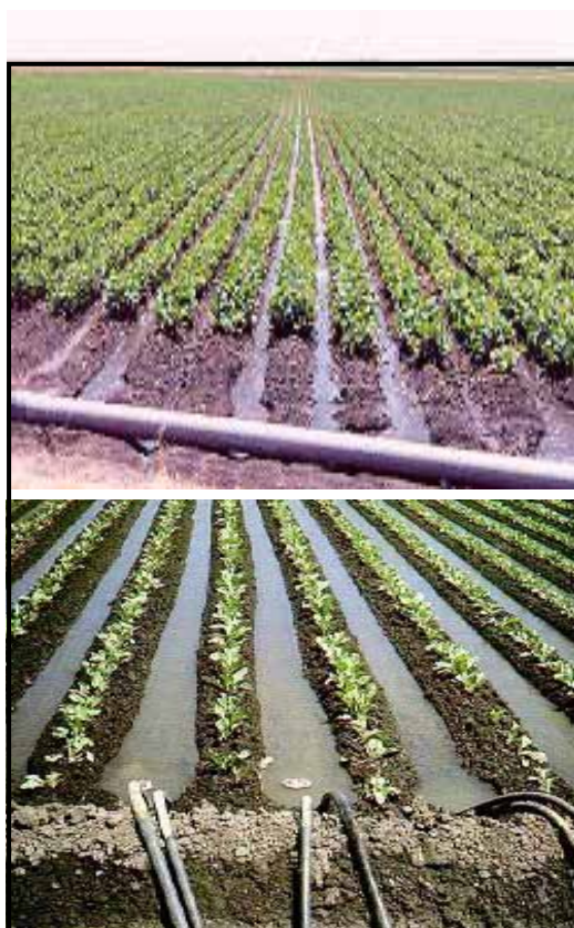
شکل ۷ - نمایی از مزارع تحت آبیاری نشتی

سبک طول کمتر و در خاک‌های سنگین طول بیشتر) در نوسان است. دامنه شیب‌های ۰/۱ تا ۰/۷ درصد قابل استفاده ولی مناسب‌ترین شیب برای آبیاری شیاری ۰/۲ تا ۰/۴ درصد است. این روش به سادگی در تمام مراحل رشد سویا حتی در مرحله جوانه‌زنی و خاک‌های سنگین که در روش‌های آبیاری غرقابی و نواری با مشکل مواجه هستند، امکان پذیر است.