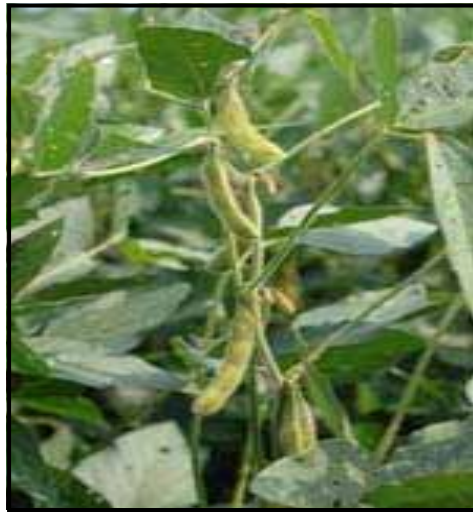
شکل ۳- غلاف کامل در سویا

دانه‌های موثر برای عملکرد باشند (شکل ۳) و در خاک رطوبت مناسب برای ادامه رشد در دسترس باشد، می‌توان آبیاری را قطع کرد. اما اگر خاک خشک باشد یک آبیاری دیگر برای دریافت حداکثر عملکرد نیاز است. برای تشخیص کافی بودن رطوبت خاک برای تکمیل رشد دانه‌ها از روش لمسی می‌توان نمونه‌هایی از خاک تا عمق توسعه ریشه از چند نقطه از مزرعه را برداشت نموده و اگر این نمونه‌ها به سادگی در دست به صورت نوار باریک یا گلوله تبدیل شوند نشانه رطوبت مناسب در خاک می‌باشد.