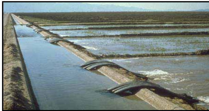
شکل ۶- نمایی از روش آبیاری نواری

اینکه در این روش برای تکمیل آبیاری و رسیدن آب به انتهای مزرعه نیاز به جریان ورودی زیاد و احتمال غرقاب شدن خاک نیز وجود دارد (شکل ۶)، قابل توصیه برای آبیاری در مرحله جوانه‌زدن سویا نیست. اما در صورت ضرورت بهتر است برنامه‌ریزی آبیاری طوری صورت گیرد که حداکثر ۲۴ ساعت آب در داخل مزرعه باشد تا شرایط غرقاب منجر به از بین بردن گیاه نگردد.