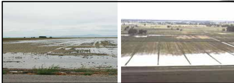
شکل ۵- نمایی از روش آبیاری کرتی در مزرعه

شرایط به گونه‌ای باشد که حداکثر طی ۴۸ ساعت آب را قطع نمود. البته این روش برای خاک‌های شور به دلیل شستشوی بهتر املاح از نیم‌رخ خاک نسبت به دیگر روش‌های سطحی مناسب‌تر است.