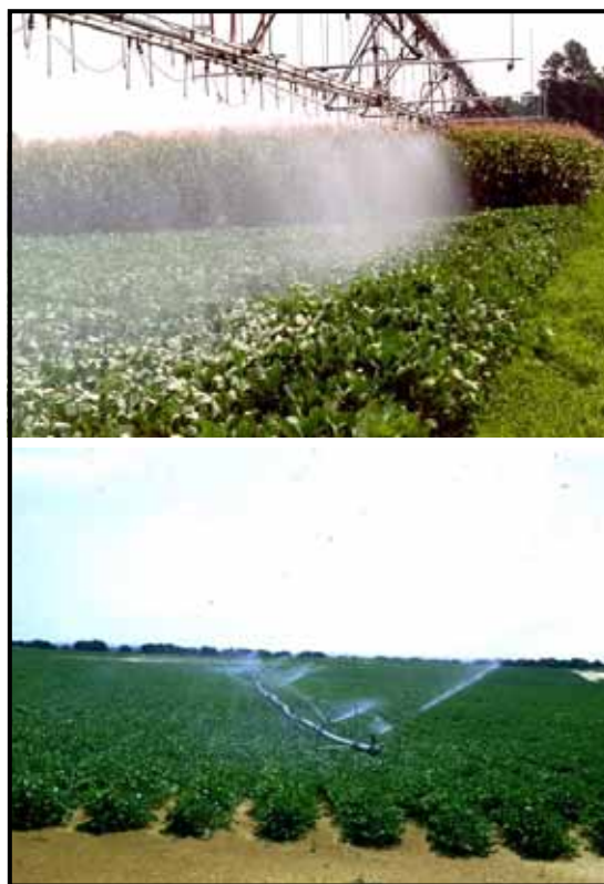
شکل ۸- نمایی از مزرعه تحت آبیاری بارانی