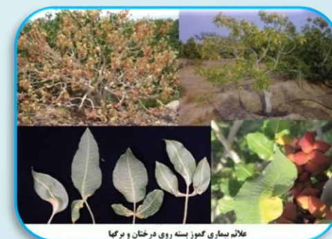
علامه بیماری گموز پسته روی درختان و برگها

خسارت: این بیماری از ناحیه پوست و ریشه وارد آوندهای درخت شده و مانع رسیدن آب و غذا به برگ‌ها و میوه می‌شود و در نتیجه طی دو تا ۴ سال باعث خشک شدن درخت می‌شود.