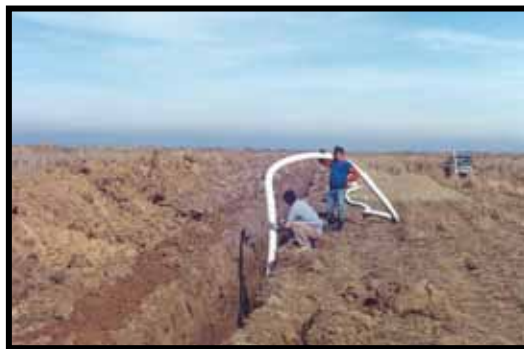
شکل ۲- عملیات لوله‌گذاری در مزرعه آزمایشی کشت و صنعت مغان

نتایج نشان داد در حالت اول به ترتیب استفاده از روش‌های باور و وان شیلفگارد، دام، گلوور و وان شیلفگارد مناسب هستند. در حالت دوم به ترتیب فرمول‌های حماد با ۳ درصد، باور و وان شیلفگارد با ۶ درصد و وان شیلفگارد با ۷ درصد متوسط انحراف از فاصله واقعی زهکش‌های زیرزمینی بهترین کارایی را نشان دادند. بیشترین انحراف از فاصله واقعی زهکش‌ها مربوط به فرمول دام با ۱۸/۵ درصد بود.