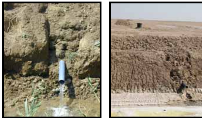
شکل ۱- خروجی زهکش‌های زیرزمینی در مناطق خوزستان و مغان