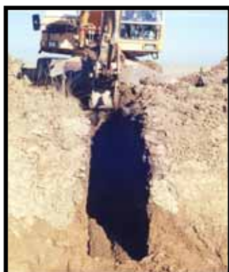
شکل ۳- حفر ترانشه زهکش زیرزمینی در مزرعه آزمایشی آونجان فارس

نتایج نشان داد که در حالت اول به ترتیب استفاده از روش‌های گلوور، دام، وان شیلیفگارد و باور و وان شیلیفگارد قابل توصیه هستند. در حالت دوم به ترتیب فرمول‌های دام با ۱۱/۲۵ درصد و گلوور با ۱۳/۸ درصد متوسط انحراف از فاصله واقعی زهکش‌های زیرزمینی بهترین کارایی را دارا بودند. در جدول ۳ نتایج هفت تحقیق ذکر شده فوق، خلاصه و جمع‌بندی شده است.