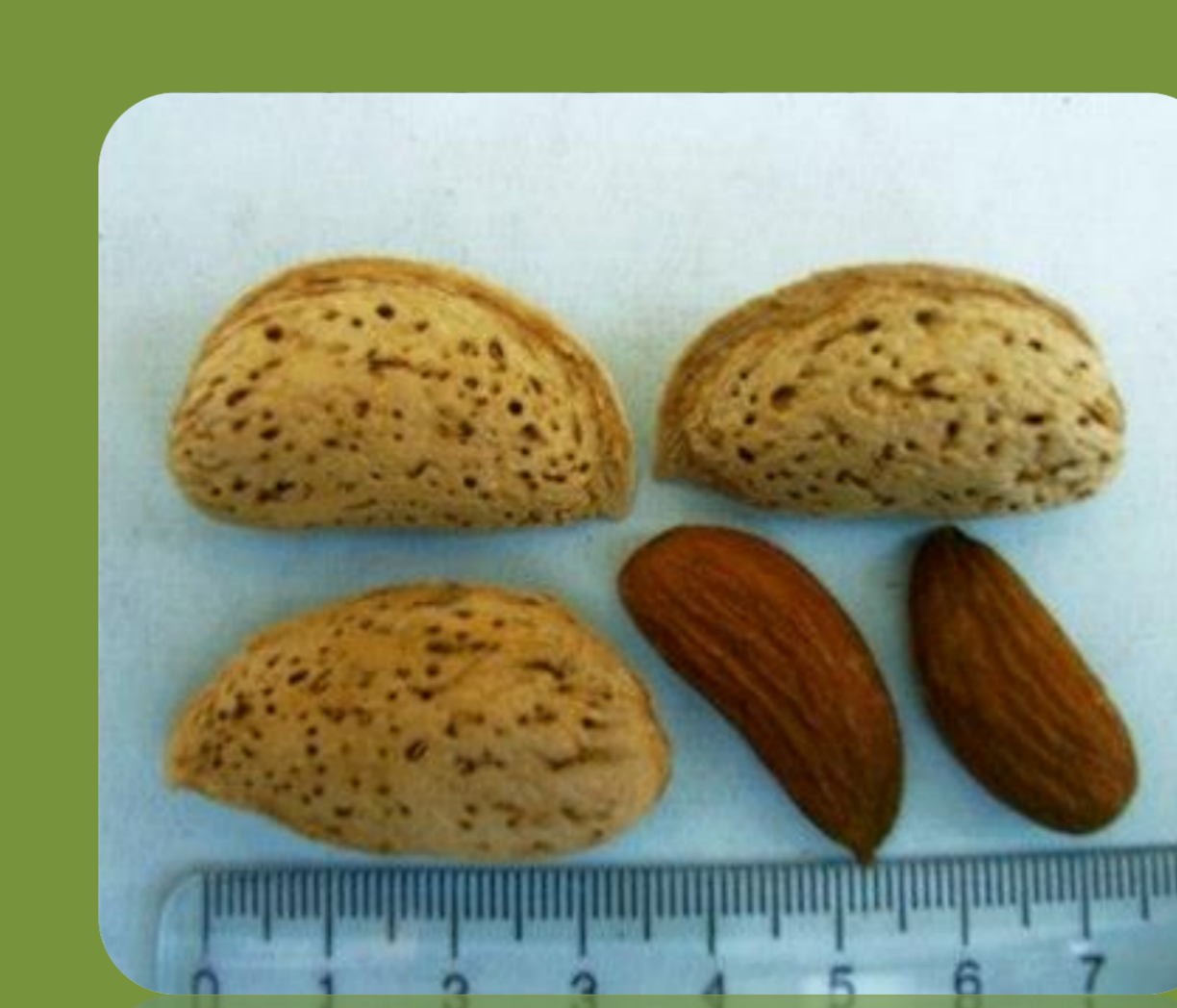
رقم یلدا زمان گلدهی: میان گل درصد مغز: ۵۰ عملکرد: پربار درصد مغز دوقلو: ۵ رقم گرده دهنده: آذر و نون پاریل