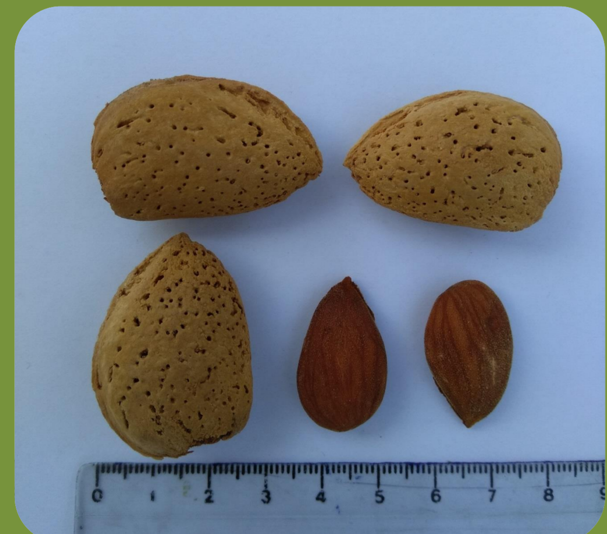
رقم تونو زمان گلدهی: نسبتاً دیرگل درصد مغز: ۳۸ عملکرد: پربار درصد مغز دوقلو: ۲۰ رقم گرده دهنده: خوبارور