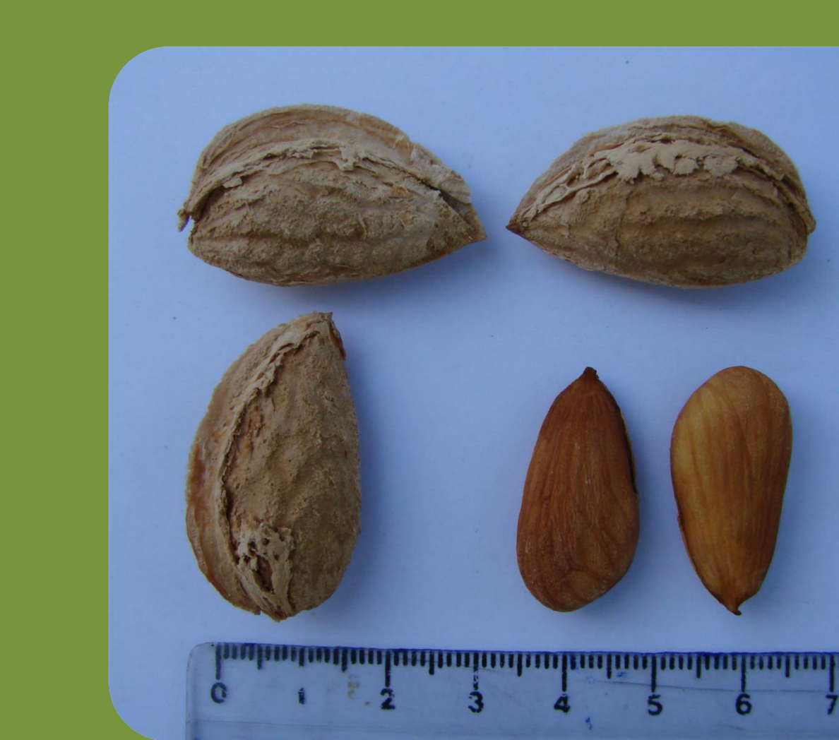
رقم اسکندر زمان گلدهی: دیرگل درصد مغز: ۴۹ عملکرد: پربار درصد مغز دوقلو: ۴ رقم گرده دهنده: فرانسیس و آذر