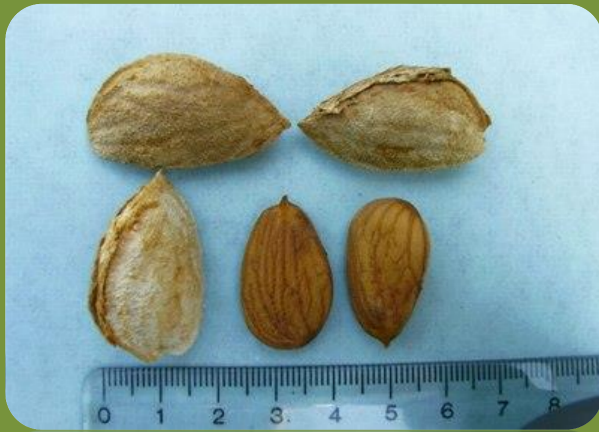
رقم نون پاریل زمان گلدهی: نسبتاً دیرگل درصد مغز: ۶۵ عملکرد: پربار درصد مغز دوقلو: ۵ رقم گرده دهنده: تکزاس و آذر

وزارت جهاد کشاورزی سازمان تحقیقات، آموزش و ترویج کشاورزی مرکز تحقیقات و آموزش کشاورزی و منابع طبیعی آذربایجان شرقی