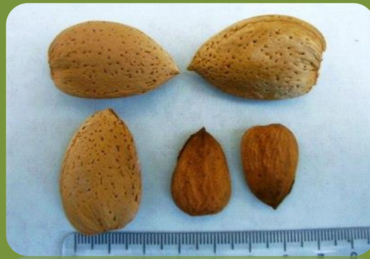
رقم سهند زمان گلدهی: خیلی دیرگل درصد مغز: ۲۸ عملکرد: خیلی پربار درصد مغز دوقلو: ۱۵ رقم گرده دهنده: فرانسیس و شکوفه