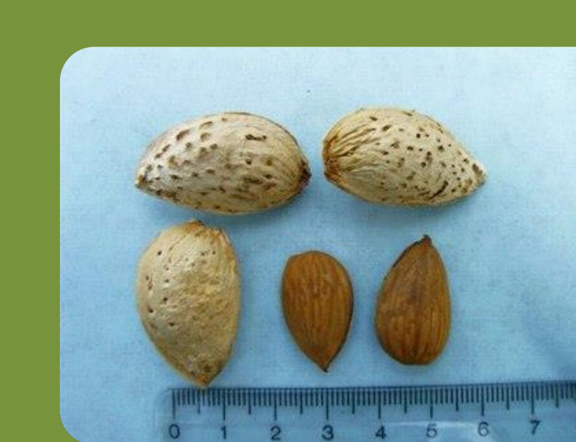
رقم منقا زمان گلدهی: زودگل درصد مغز: ۵۵ عملکرد: پربار درصد مغز دوقلو: ۱۰ رقم گرده دهنده: ارقام زودگل بادام