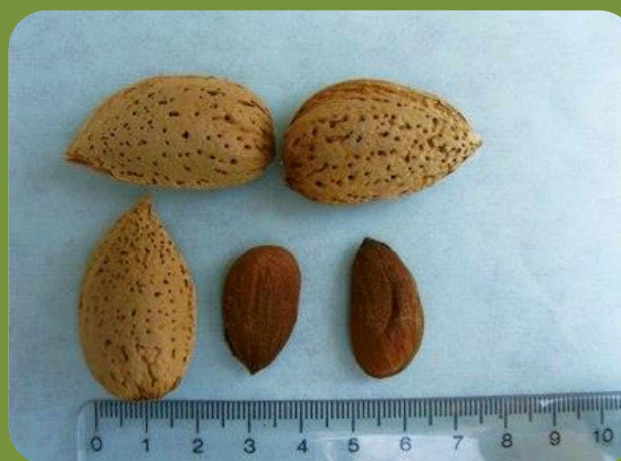
رقم A200 زمان گلدهی: خیلی دیرگل درصد مغز: ۳۲ عملکرد: پربار درصد مغز دوقلو: صفر رقم گرده دهنده: فرانسیس، سهند و شکوفه