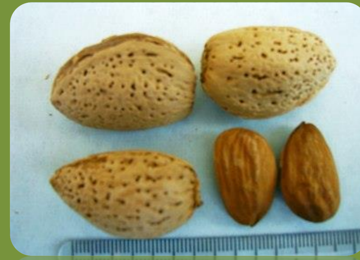
رقم آذر زمان گلدهی: نسبتاً دیرگل درصد مغز: ۴۲ عملکرد: پربار درصد مغز دوقلو: ۳ رقم گرده دهنده: شکوفه و نون پاریل