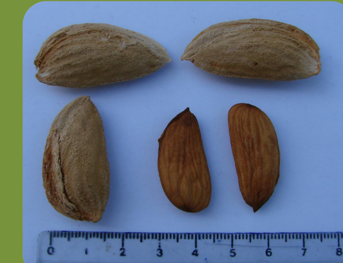
رقم آراز زمان گلدهی: دیرگل درصد مغز: ۶۰ عملکرد: متوسط درصد مغز دوقلو: صفر رقم گرده دهنده: فرانسیس و آذر