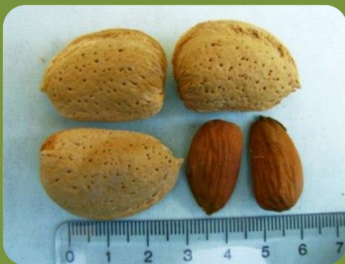
رقم فرانسیس زمان گلدهی: خیلی دیرگل درصد مغز: ۳۸ عملکرد: پربار درصد مغز دوقلو: صفر رقم گرده دهنده: فرادوتل، Ai و سهند