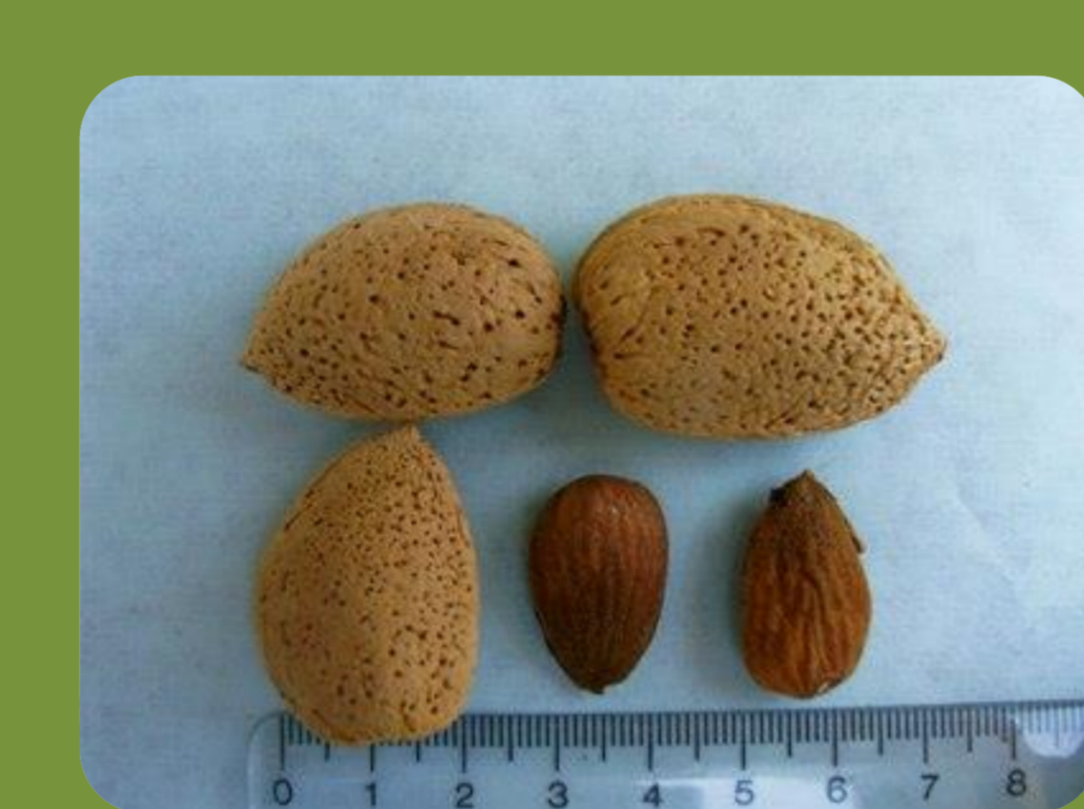
رقم A230 زمان گلدهی: خیلی دیرگل درصد مغز: ۳۳ عملکرد: بسیار پربار درصد مغز دوقلو: ۲ رقم گرده دهنده: فرانسیس، سهند و شکوفه