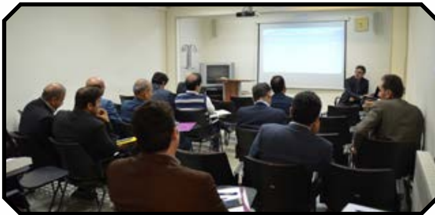
برگزاری کارگاه آموزشی حفظ کاربری اراضی زراعی و باغی

حفاظتی اراضی کشاورزی کشور و بالطبع استان‌ها را تکمیل نموده و در همین زمان کوتاه با افزایش دریافت گزارش‌های مردمی و همچنین درخواست مردم برای اخذ مشاوره، اثرات راه اندازی این خط تلفنی کاملاً مشهود شده است.