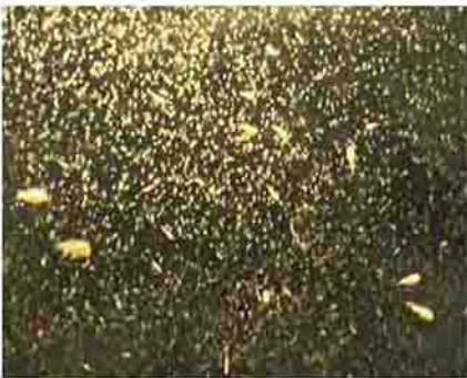
۹- تراکم انبوه روتیفر در لایه های مختلف آب