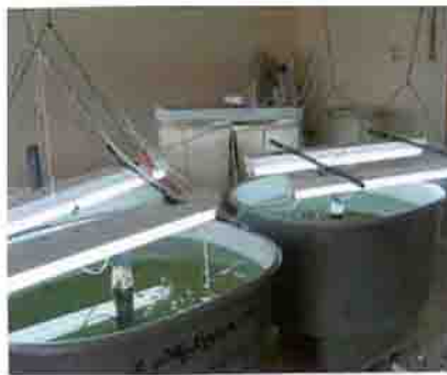
۸- پرورش انبوه روتیفرها در مخازن نیم تنی حاوی جلبک