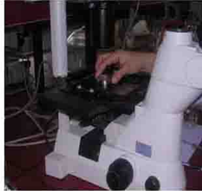
۲- جداسازی روتیفر