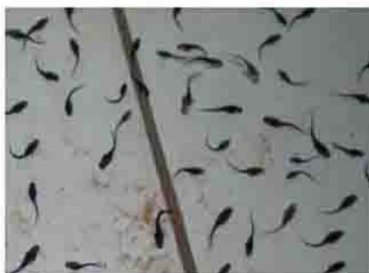
۱۱- تغذیه لاروهای ماهیان خاویاری با روتیفرهای غنی شده