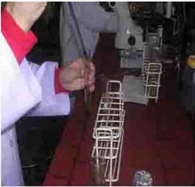
۶- پرورش روتیفرها در حجم ۳۰ سی سی