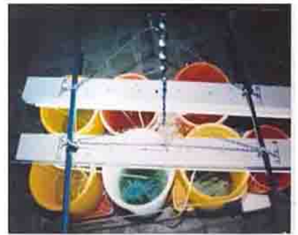
۷- پرورش روتیفرها در مخازن ۶ لیتری