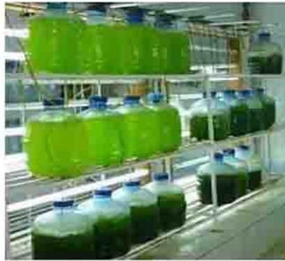
۵- کشت انبوه جلبک در حجم های ۲۰ لیتری