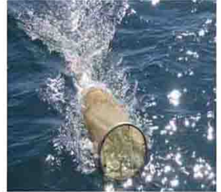
۱- جمع آوری روتیفرها از استخرها و آبگیرهای طبیعی با تور پلانکتون (چشمه ۱۵۰ میکرون)