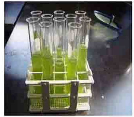
۴- کشت اولیه جلبک Scenedesmus obliquus