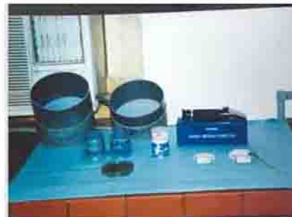
۱۰- جداسازی روتیفرها با استفاده از الک (چشمه ۵۰ میکرون)