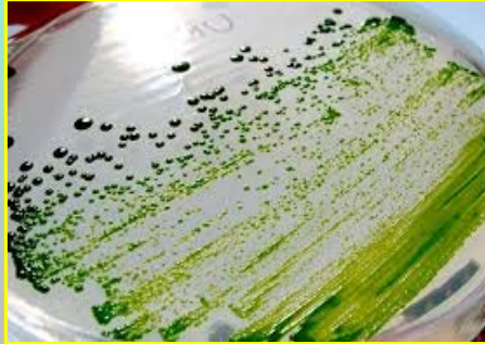
۲- کشت ریز جلبک ها در محیط کشت جامد آگار