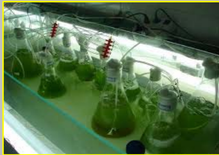
۵- کشت ریز جلبک ها در حجم ۵۰۰ سی سی