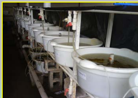
۱۰- تغذیه لاروهای ماهیان خاویاری با دافنی های غنی شده