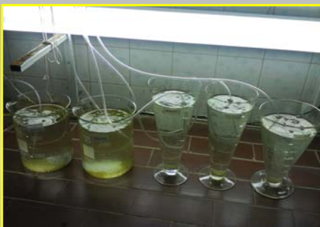
۹- غنی سازی دافنی ها با ریز جلبک ها