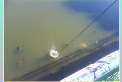
۱- جمع آوری ریز جلبک ها با استفاده از تور پلانکتون