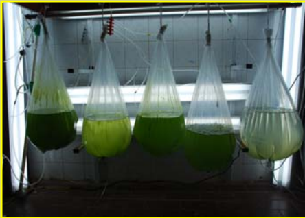
۶- کشت انبوه ریز جلبک ها