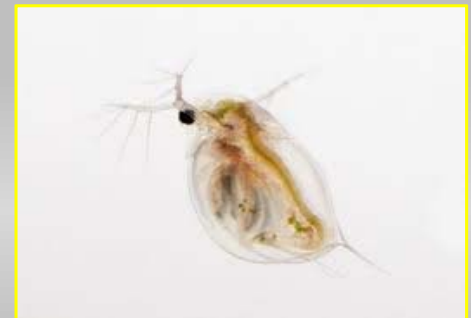
۷- Daphnia longispina