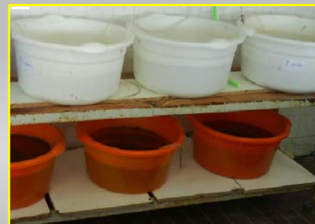
۸- مخازن پرورش دافنی ها