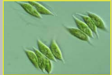
۴- ریز جلبک Scenedesmus dimorphus