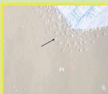
۸- تکثیر سلول های باله دمی پس از ۴۸ ساعت