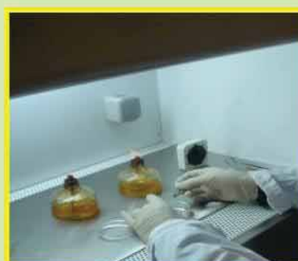
۵- خرد کردن تکه باله دمی به قطعات تقریباً ۱ میلیمتر