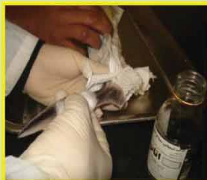
۲- ضد عفونی کردن باله دمی با الکل ۷۰٪