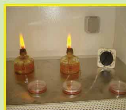
۴- شستشوی بافت با محیط کشت پایه حاوی آنتی بیوتیک ها و ضد قارچ