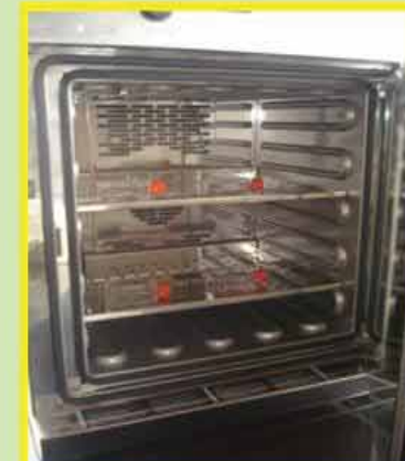
۷- افزودن محیط کشت و قرار دادن نمونه ها در دستگاه انکوباتور