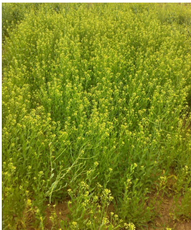
شکل ۶: تصویری از کاملینا رقم سهیل در مرحله گلدهی