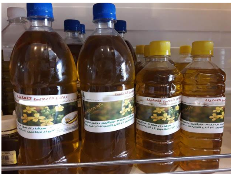
شکل ۳: روغن کاملینا، محصول شرکت دانش‌بنیان بیستون شفا