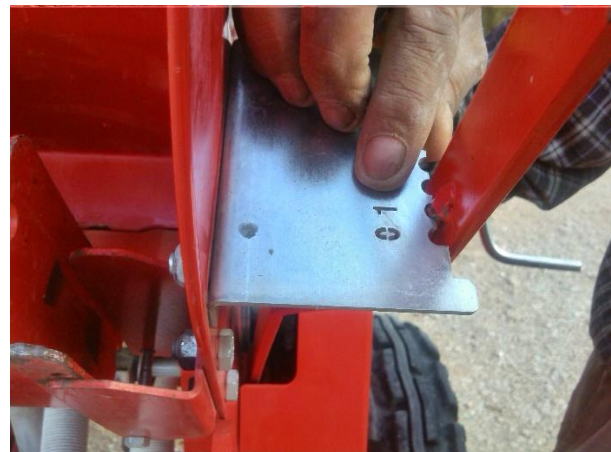
شکل ۴: دستگاه ریزدانه کار و نحوه تنظیم آن (پردیس کشاورزی و منابع طبیعی دانشگاه رازی کرمانشاه)