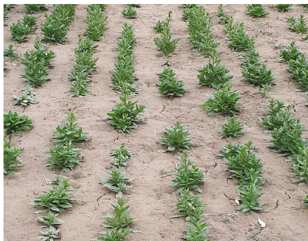
شکل ۸: گیاه کاملینا در مرحله روزهت و در شرایط کشت آبی (ایستگاه تحقیقات کشاورزی زهک)