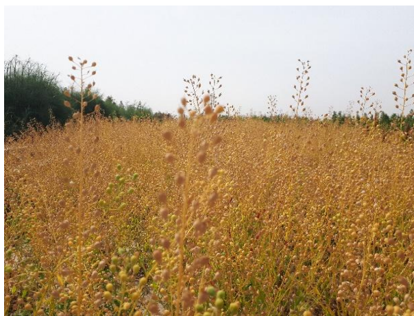
شکل ۱۰: گیاه کاملینا در مرحله رسیدگی در شرایط کشت آبی (ایستگاه تحقیقات کشاورزی زهک)