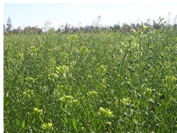
شکل ۹: گیاه کاملینا در مرحله گلدهی و تشکیل خورجین در شرایط کشت آبی (ایستگاه تحقیقات کشاورزی زهک)