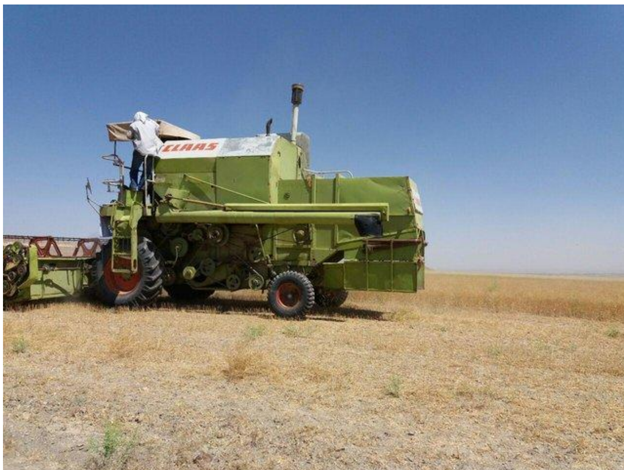
شکل ۵: برداشت کاملینا با کمباین