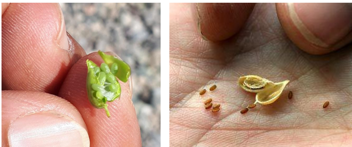
شکل ۱: خورجین و دانه کاملینا در مراحل تشکیل خورجین و رسیدگی کامل (ایستگاه تحقیقات کشاورزی زهک)

وزن هزاردانه این گیاه از ۰/۸ تا ۲ گرم متغیر است. بذور این گیاه دارای ۳۸ تا ۴۳ درصد روغن و ۲۷ تا ۳۲ درصد پروتئین هستند (پارکر، ۲۰۱۴). همانطور که در شکل ۱ نشان داده شده است، خورجین کاملینا گلابی شکل و به قطر ۵ میلی‌متر و طول ۱۰ تا ۲۵ میلی‌متر و به رنگ زرد است. رنگ دانه‌ها قهوه‌ای تیره و متمایل به قرمز می‌باشد (شکل ۲). در طول برداشت، شرایط نامطلوب آب و هوایی می‌تواند منجر به کاهش عملکرد دانه شود، رطوبت دانه‌ها در زمان برداشت حدود ۱۱ و در زمان ذخیره‌سازی به کمتر از ۸ درصد می‌رسد. طعم تلخ دانه کاملینا شبیه به ساقه کلم و دارای عطر و طعم کلم قمری می‌باشد (شوستر و فرید، ۱۹۹۸).