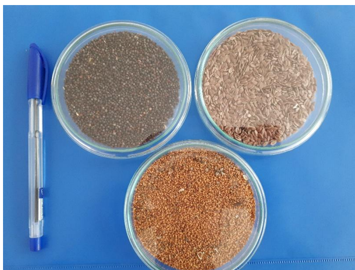
شکل ۲: دانه کاملینا (پایین) در مقایسه با دانه کلزا (بالا سمت چپ) و دانه کتان قرمز (بالا سمت راست) (ایستگاه تحقیقات