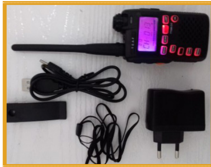
بی سیم (واکی تاکی)