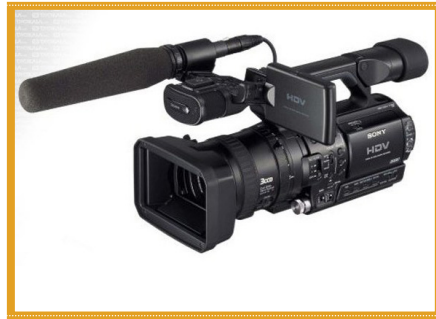
دوربین تصویربرداری Full HD