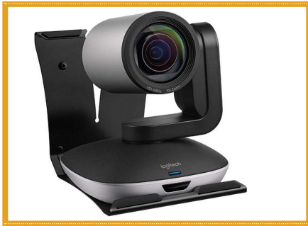
دوربین کنفرانس Full HD