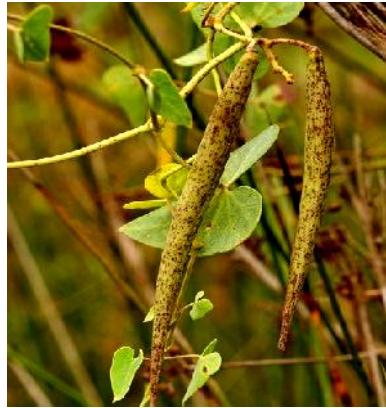
شکل ۶- میوه کاتوس