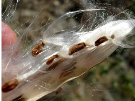
گرده‌افشانی کاتوس توسط حشرات صورت می‌گیرد ۲ (شکل ۸).