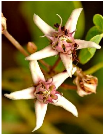
شکل ۸- حشرات روی گل کاتوس عامل انتقال دانه گرده هستند

ضمن تماس حشره با گل، صفحه پایه‌ای چسبناک ناقص ۳ به سر حشره متصل می‌شود. تمام این صفحه به همراه محتویات دانه گرده به وسیله حشره از یک گل به گل دیگر