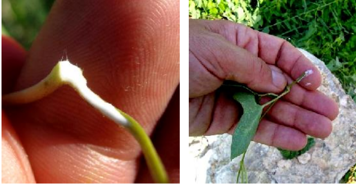
شکل ۴- خروج شیرابه از محل قطع دمبرگ کاتوس

ساقه: ساقه سبز، بالارونده و محتوی شیرابه‌ای سفیدرنگ می‌باشد. کاتوس دارای لوله‌های شیرابه‌ای حقیقی است و با قطع اندام‌ها، شیرابه‌ای سفیدرنگ از این لوله‌ها خارج می‌شود (شکل ۴).