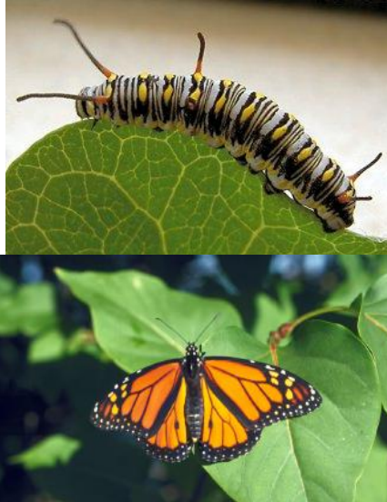
شکل ۹- لارو (راست) و حشره کامل (چپ) Danaus chrysippus روی برگ کاتوس

است (Tewksbury et al. ۲۰۰۲). گزارش‌های فوق‌نویدبخش مدیریت بیولوژیکی کاتوس هستند، اما با این حال، کنترل بیولوژیکی آن نیاز به بررسی‌های گسترده‌ای دارد و در حال حاضر نتایج قابل اطمینانی در دسترس نیست.