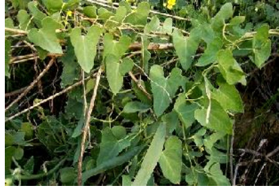
شکل ۲- اندام‌های رویشی کاتوس