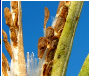
شکل ۷- مراحل رسیدگی و ساختار بذر کاتوس