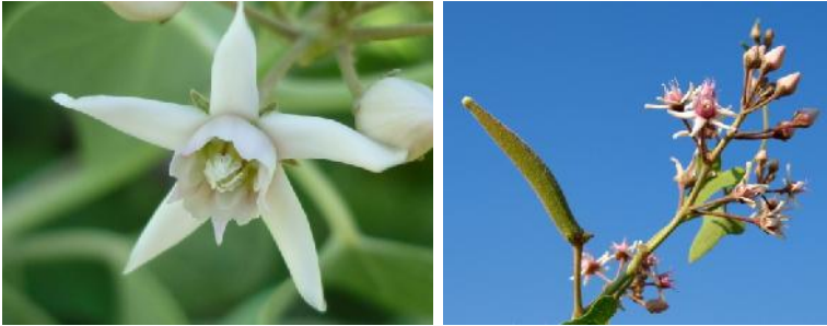
شکل ۵- ساختار گل آذین و گل در کاتوس

دانه‌های گرده اغلب به هم متصلند و در کیسه گرده مومی قرار دارند. تخمدان فوقانی، دوبرچه‌ای، برچه‌های جدا از هم، اما خامه و کلالة به هم پیوسته و هر یک میوه بر گه به شکل دوکی و صاف ایجاد می‌کنند. هر میوه محتوی ۷ تا ۱۰ بذر است که در زمان رسیدن و بازشدن، ریزش خواهد کرد (شکل ۶).